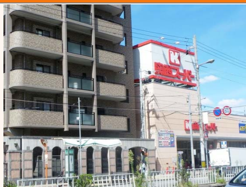
⇒②地下鉄今福鶴見駅北詰 (市営バス停、関西スーパー南)