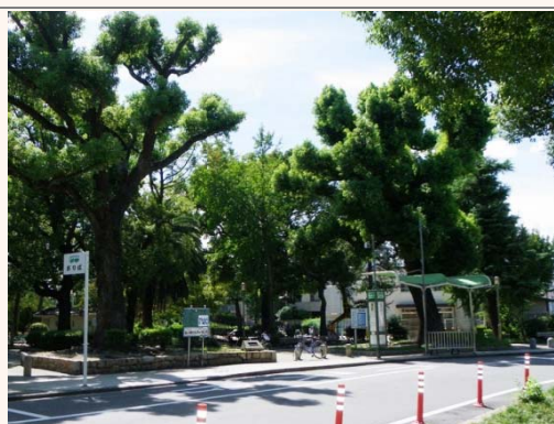
⇒④市営バス新森公園前バス停前