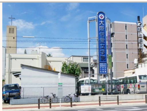
⇒③市営バス緑 1 丁目中バス停 (緑 1 丁目南交差点南)