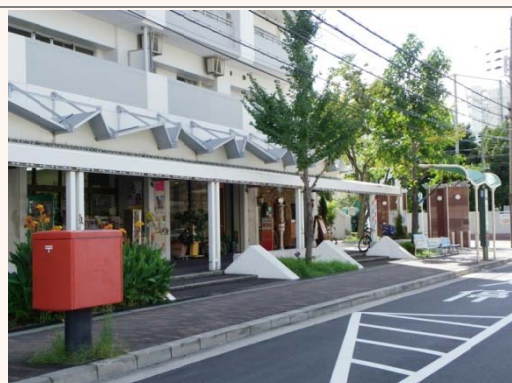
⇒⑤市営バス古市 3 丁目バス停手前、 郵便ポスト付近